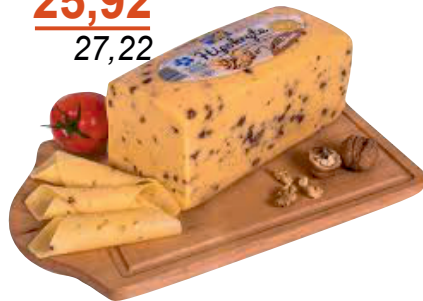
Ser żółty Hipokryta z orzechami blok