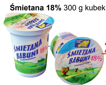
Śmietana 18% 300 g kubek