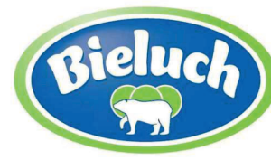
Twaróg półtłusty 250 g