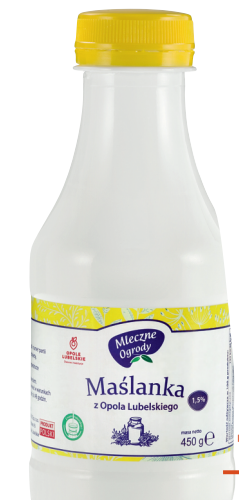
Maślanka naturalna butelka 450 g