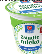
Mleko zsiadłe kubek 350g