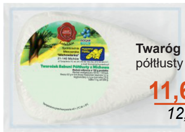
Twaróg Babuni półtłusty kliniek