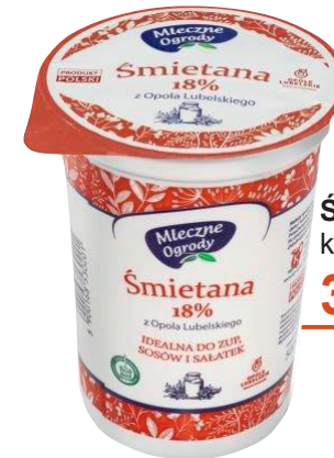
Śmietana 18% kubek 500 g