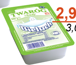
Twaróg chudy 250 g