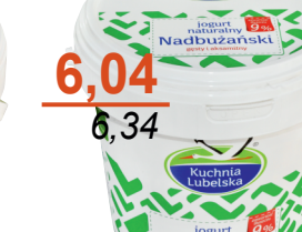
Jogurt nadbużański 9% 1L