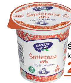
Śmietana 18% kubek 350 g