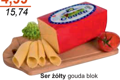
Ser żółty gouda blok