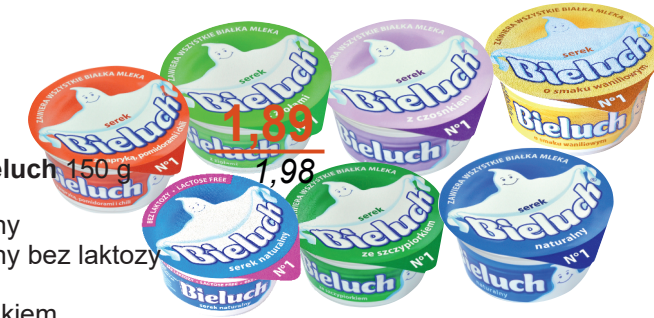
Serek Bieluch 150 g -lekki -naturalny -naturalny bez laktozy -wanilia -z czosnkiem -z papryką, pomidorami i chili -z ziołami -ze szczypiorkiem