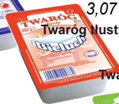
Twaróg tłusty 250 g