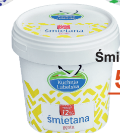
Śmietana 12% 1L