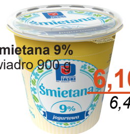
Śmietana 9% wiadro 900 g